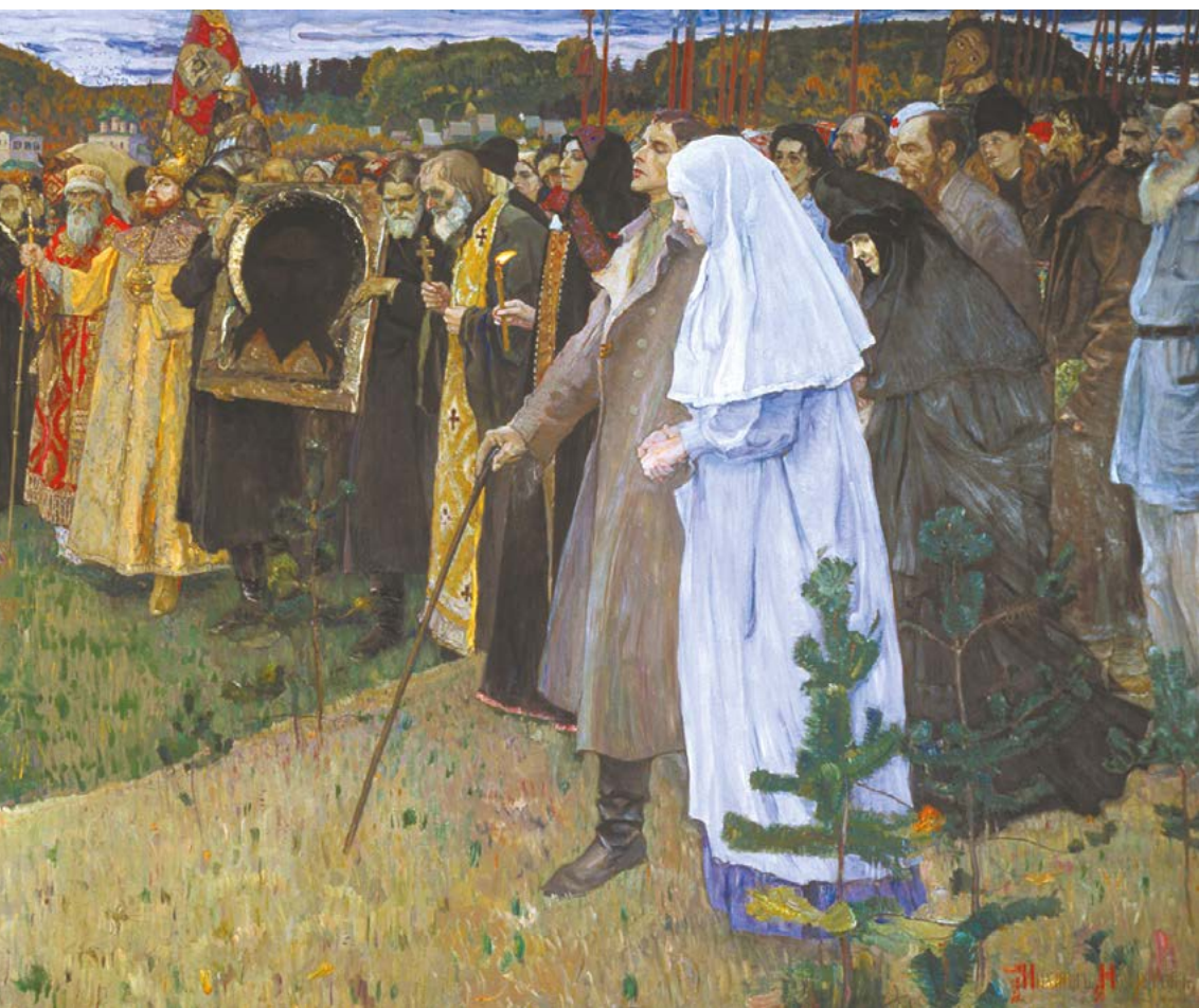
Нестеров М.В. Душа народа, 1915–1916 гг.

Школьные годы провёл в Оренбургской мужской гимназии в городе Уфе. Осенью 1874 г. по распоряжению отца будущий художник переехал в Москву, чтобы поступить в техническое училище. Не выдержав экзаменов, поступил в реальное училище. В 1877 г. поступил в Московское училище живописи, ваяния и зодчества, где учился под руководством П. С. Сорокина, И. М. Прянишникова и В. Г. Перова, который был его любимым преподавателем и оказал сильное влияние на раннее творчество художника. В училище пробыл три года. В 1881 г. переехал в Петербург, где поступил в Академию художеств. Петербургская академия разочаровала молодого художника, который в 1882 г. вернулся в Москву с надеждой вновь поступить в училище к Перову, однако любимый преподаватель был тогда уже при смерти. Нестеров успел написать портрет угасающего наставника. В 1882 г. вновь поступил в Училище живописи, учился у А. К. Саврасова, В. Е. Маковского.