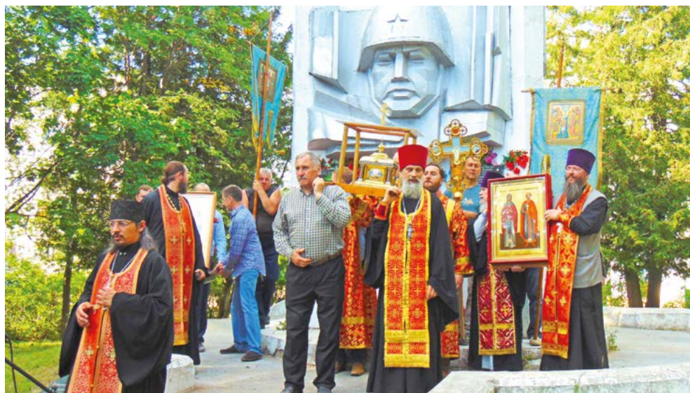
Большой Волжский у храма Иерусалимской иконы Богородицы

Большой Волжский крестный ход – современный самый продолжительный и протяженный (около 800 км) из ежегодных многодневных крестных ходов проходит в июне – июле. Маршрут: от истока Волги (село Волговерховье, Ольгин монастырь) через Климову гору, Нилову пустынь, Осташков, Торопец, Торжок, Ельцы, Ржев, Зубцов, Тверь, Удомлю, Конаково, Дубну, Кимры, Кашин. Завершается ход в городе Калязине.