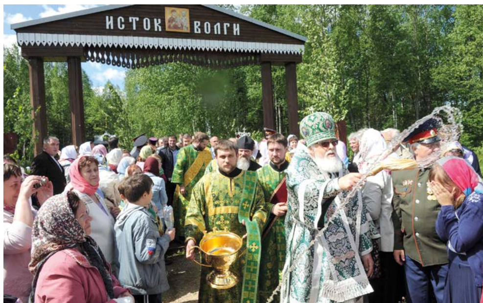
Большой Волжский крестный ход у истока Волги

Волжский крестный ход ведет свою историю с 1999 г. Тогда в преддверии 2000-летия Рождества Христова по благословению Патриарха Московского и всея Руси Алексия II 20 июня от истока Волги начался Крестный ход по водам трех великих славянских рек: Волги, Днепра, Западной Двины.