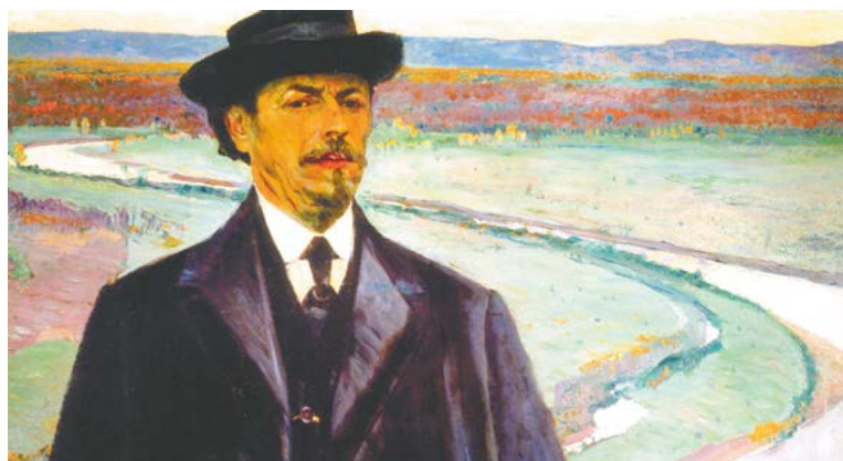
М. В. Нестеров. Автопортрет. 1915 г.

С 1884 г. писал жанровые картины на исторические темы. В 1885 г. за картину «Призвание М.Ф. Романова на царство» получил звание свободного художника. 1