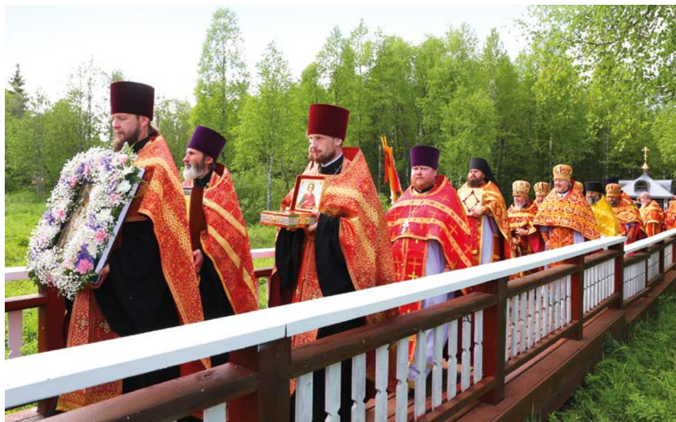
Большой Волжский крестный ход у истока Волги

В этом году Волжский крестный ход был посвящён 200-летию обретения мощей княгини (мученицы) Иулиании Вяземской и Новоторжской. Святыня Крестного хода – икона святой благоверной княгини из церкви в честь Архангела Михаила города Торжка. XXI Волжский крестный ход начался 1 июня от истока Волги в деревне Волговерховье. Событие собрало более 1,5 тысячи человек из Тверской, Московской, Новгородской и других областей. Божественную литургию и чин малого водоосвящения провёл митрополит Тверской и Кашинский Савва.