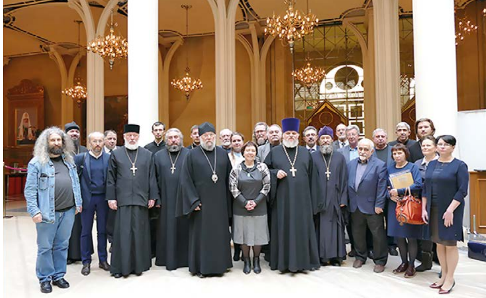
Члены Экспертного совета по церковному искусству, архитектуре и реставрации