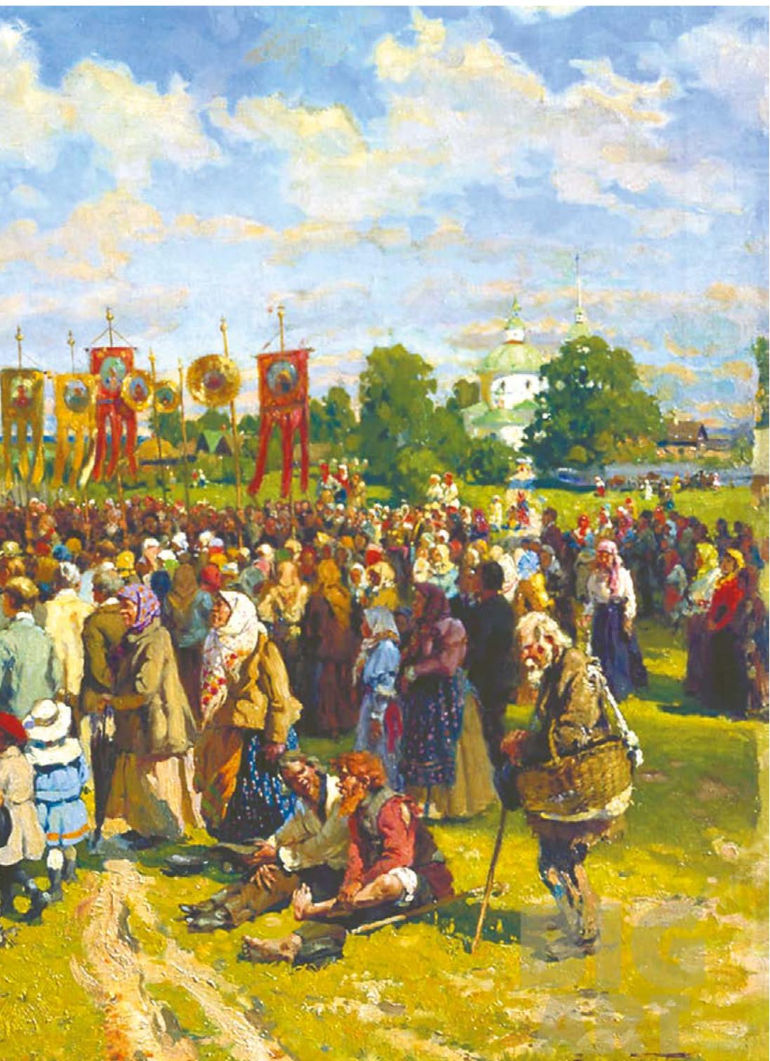
А.В. Маковский. Крестный ход на Флора и Лавра. 1921-192 г.