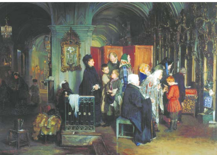
Корзухин А. Перед исповедью, 1877 г.

ских праздников особым почитанием среди всех сословий дореволюционной России пользовались три праздника: праздник Светлого Христова Воскресения – Пасха, праздник Рождества Христова и праздник Святой Троицы. Митрополит Вениамин (Федченков) вспоминает, что первое впечатление, связанное в памяти с православной верой, было празднование в семье Пасхи: