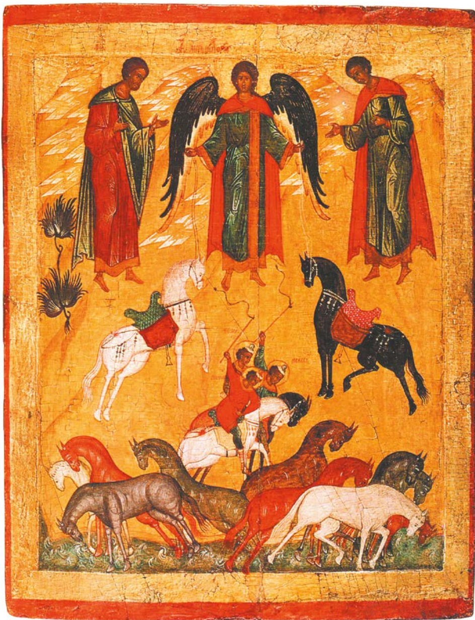
Чудо о Флоре и Лавре