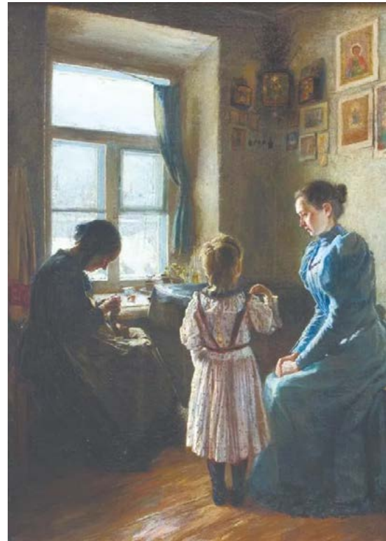
Матвеев И. Детская молитва, 1895 г.

«Конечно, не помню, как и когда заброшены были в мою душу первые слова и мысли о вере матерью ... Память уже застала меня верующим, – какими были и мои родители, как и вообще все окружающие, люди из “простого”, почти деревенского класса. Никаких “безбожников” я в детстве не видел и даже о них не слышал. Все кругом верили несомненно. Мир Божий, сверхъестественный, был такой же реальностью, как и этот земной. Буквально – никакой разни-