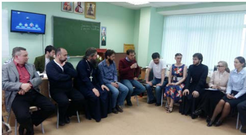
Перед аттестацией. Комиссия и катехизаторы

Конечно, в ходе работы с катехизаторами уровень их воцерковленности и вероучительной подготовки выявляется и на уровне епархии, но, по нашему убеждению, отвечать за этот уровень должен настоятель храма, в котором работает катехизатор.