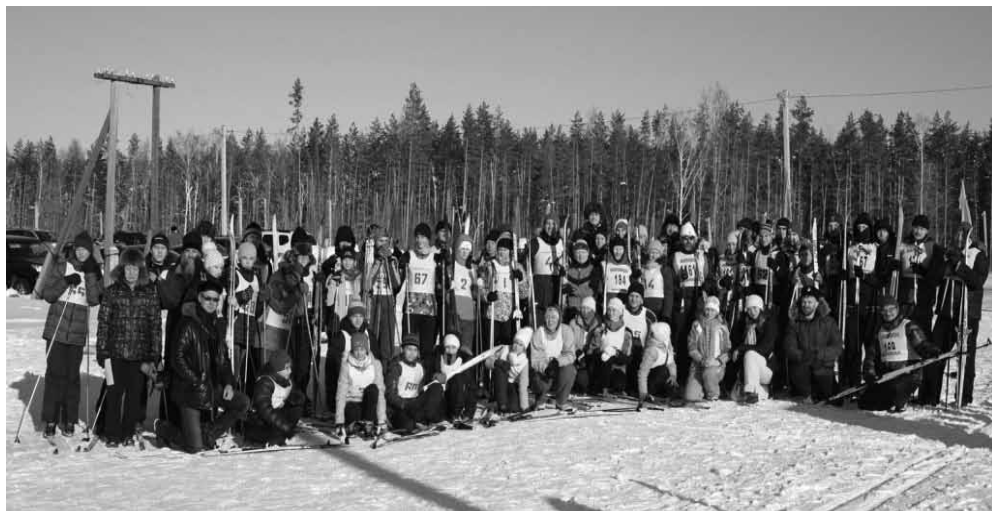
Лыжня Салаватской епархии–2016

В прошлом году в Салаватской епархии впервые прошла олимпиада по зимним видам спорта. В этом году епархия совместно с городским спортивным комитетом организовали «Лыжню Салаватской епархии» в городе Ишимбае, взяв за образец Всероссийские массовые соревнования по беговым лыжам. Это был настоящий зимний спортивный праздник! Планируем, что мероприятие станет ежегодной спортивной акцией, которая будет проходить в городах епархии.