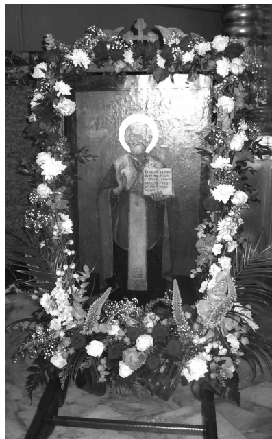
Выносная икона (Никола Летний)

В праздник Святой Троицы , а также в День Святого Духа , в День Входа