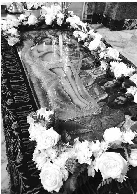
Пасха (оформление Плащаницы)

На Рождество Христово храм чаще всего убирают пахучими еловыми или другими хвойными ветвями. Обычай этот, хотя и западного происхождения, служит выражению духовной радости о рождении Спасителя. Вечнозеленая ель является символом древа жизни, возвращенного нам с рождением Спасителя. Флористика Рождества в храме чаще всего строится на символике цвета: красный – символ торжества любви Божьей, Воскрешения, Возрождения и пролитой за нас Крови Спасителя, зеленый – символ Надежды, белый – символ Света, Духовности и Чистоты. В праздники Рождества Христова (а также в праздники Богоявления, Преображения, Вознесения Господня ) принят белый цвет богослужебных облачений, поэтому в оформлении храма преобладает белый цвет.