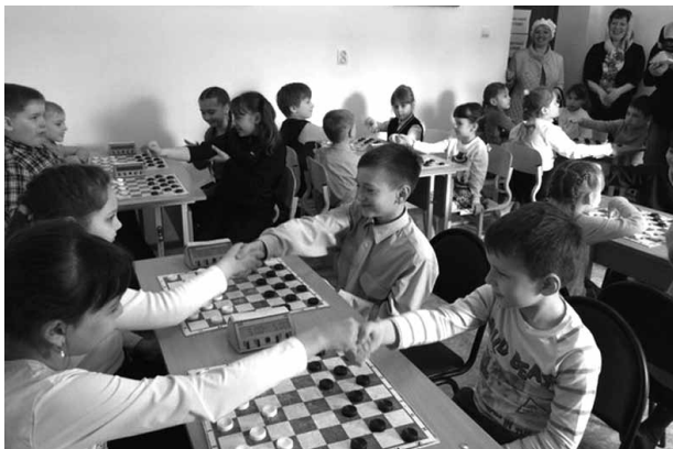
Турнир по шашкам среди учащихся воскресных школ

Кроме собственно спорта – соревнований, тренировок, мы уделяем внимание и физкультуре. Готовим проведение массовой спортивной акции «Папа, мама, я – православная спортивная семья». Пока она объединяет прихожан кафедрального собора, но рассчитываем, что со временем распространится на другие приходы епархии. Кроме того, дети имеют возможность заниматься спортом в здании самого кафедрального собора. Трансформируем актовый зал на 60-80 посадочных мест в спортивный: убираем стулья, устанавливаем складные столы для занятий настольным теннисом. Ребята также могут три раза в неделю позаниматься борьбой самбо: в зале можно разложить маты, что они делают сами. Также можно сразиться в шашки и шахматы.