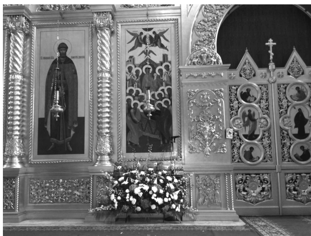
Успение (композиция у Царских врат)

цвет символизируют небесную чистоту и непорочность Богородицы, а голубой – символ Неба и глубокой Веры. Выбор цветов, ей посвященных огромен, но особенно часто в оформлении используются розы, пионы, лилии, ирисы, водосбор, ландыши и фиалки. На Благовещенье икону, а на Успение – плащаницу Богородицы принято украшать лилиями (в старину их называли кринами).