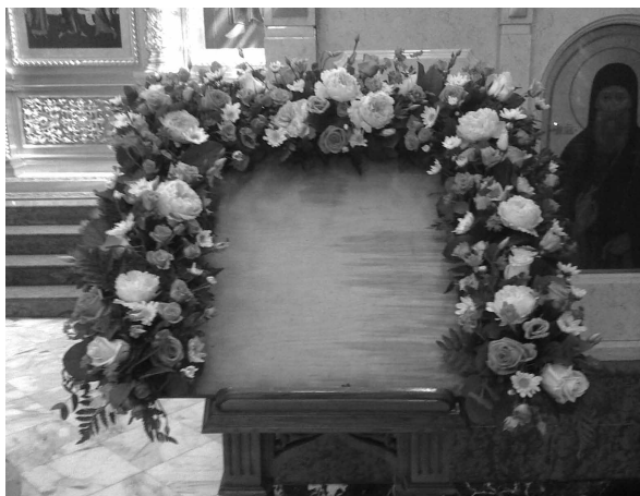
Оформление праздничной иконы

Что касается папоротников, то в храмах не рекомендуется использовать только один из его видов, а именно: офиоглосум или змеязычный, у которого спорангии собраны в кисть, напоминающую язык змеи. Но это растение чрезвычайно редкое. Обыкновенные же наши папоротники, такие как орляк, щитовник или железный папоротник