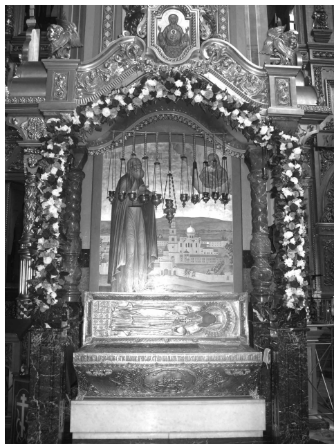
Оформление раки с мощами (праздник Пимена Угрешского)

Господня в Иерусалим облачения священнослужителей – зеленые. Русские православные церкви убираются ветками березы, а для оформления чаще всего выбирают цветы, напоминающие полевые или луговые. Пол посыпается скошенной луговой травой. Зелень и цветы символизируют весну духовную, саму Церковь Христову. Благоухание цветов знаменует собой благоухание духовных даров, подающихся душам верующих Духом Истины, Господом Животворящим. В народе прочно утвердился обычай весь год хранить троицкую зелень, прибегая к ее целебным свойствам.