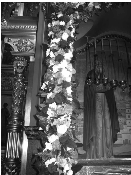
Фрагмент оформления колонны

В интерьере православного храма часто используется золотой (желтый) цвет. В воскресные дни, в дни памяти апостолов и святителей таков же цвет облачений. Этот цвет «связан с представлением о Христе как царе Славы и Предвечном Архиерее и о тех его служителях, которые собой ознаменовали в Церкви Его присутствие и имели полноту благодати высшей степени священства».