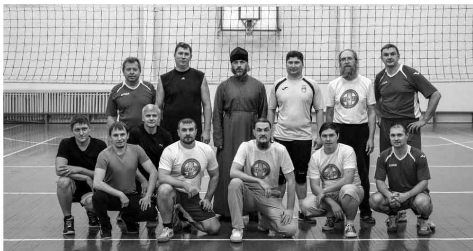
Встреча волейбольных команд администрации ГО Салават и епархии