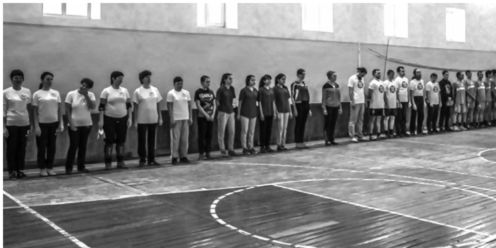
Турнир по мини-футболу в психоневрологическом интернате (ПНИ) г. Кумертау

Ребята из молодежного движения при Успенском кафедральном соборе г. Салавата принимают участие в спортивных дружеских встречах между коллективами сотрудников и пациентами психоневрологических интернатов (ПНИ) городов Салавата и Кумертау.