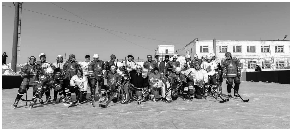
Хоккейный товарищеский матч с осужденными в ФКУ ИК-16 ФСИН РФ по РБ в г. Салавате

Сборная Салаватской епархии по хоккею с шайбой на протяжении последних трех лет 23 февраля, в День Российской армии, встречается с хоккейным клубом «Белые медведи» исправительной колонии № 16 города Салават. (Всего на территории города находится четыре исправительных учреждения, что является еще одной особенностью нашего города). В состав этого хоккейного клуба входят осужденные ФКУ ИК-16 ФСИН РФ по Республике Башкортостан в г. Салавате. Не могу не сказать несколько слов о хоккейной команде этой колонии: она единственная в Башкирии. В колонии есть свой корт, который заливают, следят за льдом. Хоккейный клуб «Салават Юлаев» в качестве благотворительной акции подарил команде исправительной колонии несколько комплектов хоккейной формы.