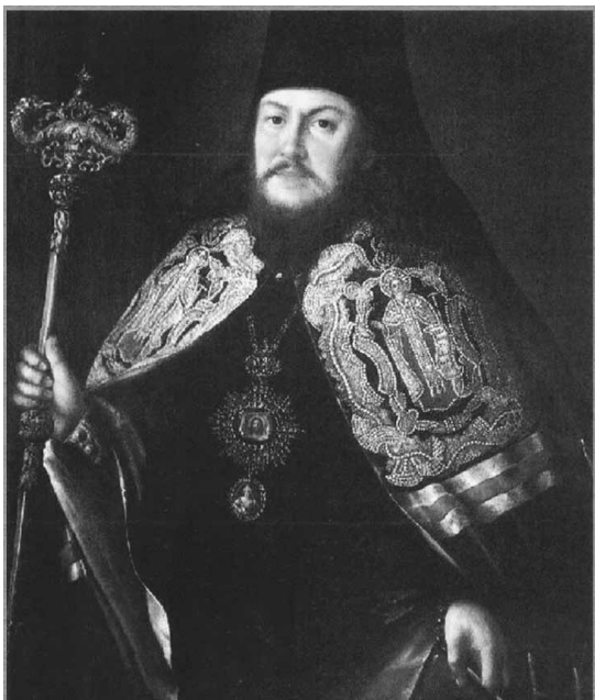
Портрет Тверского архиепископа Платона. Художник А.П. Антропов, 1775 г.

Антропов был одним из тех художников, кто способствовал возникновению и распространению в русской живописи небольшого по размерам, камерного погрудного портрета, проникнутого интересом к человеку, вне его специфически сословных черт. В каждом его портрете существует, может быть, и не очень глубоко, но по-своему прочитанный и убедительно раскрытый характер. Они лишены свойственной нередко портретам XVIII века светской эlegantности, особой изощренности в подаче модели. У Антропова все дается предельно ясно, обстоятельно, «не мудрствуя лукаво», с удивительной щедростью цветового решения.