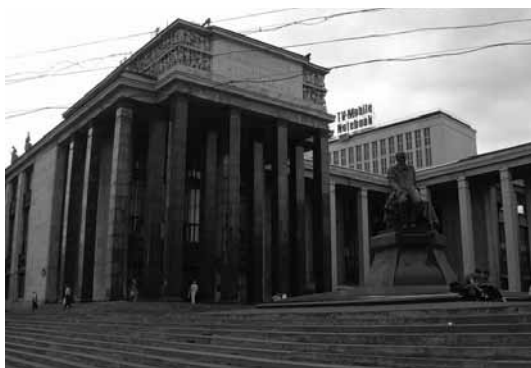
Российская Государственная библиотека

Анализ данных статистического сборника «Печать Российской