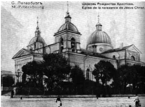
Церковь Рождества Христова в Песках в Санкт-Петербурге . Фото нач. 20 века

щенниками мест лишения свободы были в ведении Попечительных о тюрьмах комитетов. Тюремный священник получал жалование из государственной казны, которое было меньше зарплаты смотрителя тюрьмы, и практически уравнивалась с жалованием фельдшера, надзирателя, сторожа 13 - об этом свидетельствует архивное «Циркулярное предписание городских тюрем»: иногда размер оплаты труда священника составлял всего 40 руб.