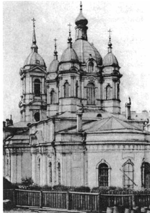
Санкт-Петербург. Церковь св. Апостола Матфея

В православных приходах создавали народно-миссионерские союзы для изучения «заблуждений петербургских сектантов со специальной целью миссионерской борьбы». В апреле 1909 г. их было четыре: Воскресенский у Варшавского вокзала, Иоанно - Предтеченский на Выборгской стороне, Матфиев-