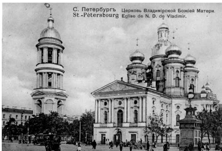
Санкт-Петербург. Церковь Владимирской Божией Матери

и имена проповедников печатались в отдельной брошюре 15 .