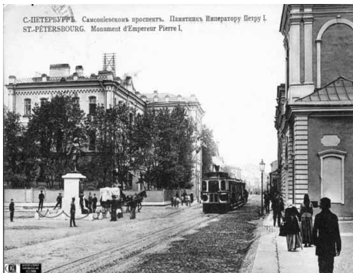
Санкт-Петербург. Самсоновский проспект. Памятник Императору Петру I

ность представители Православной церкви 2 .